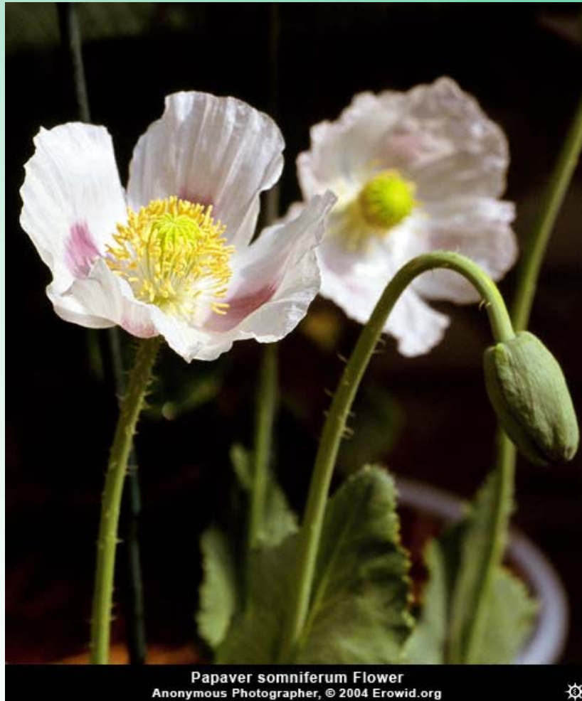
Papaver somniferum Flower

142/2004. korm. rend. módosítás, 2008. november