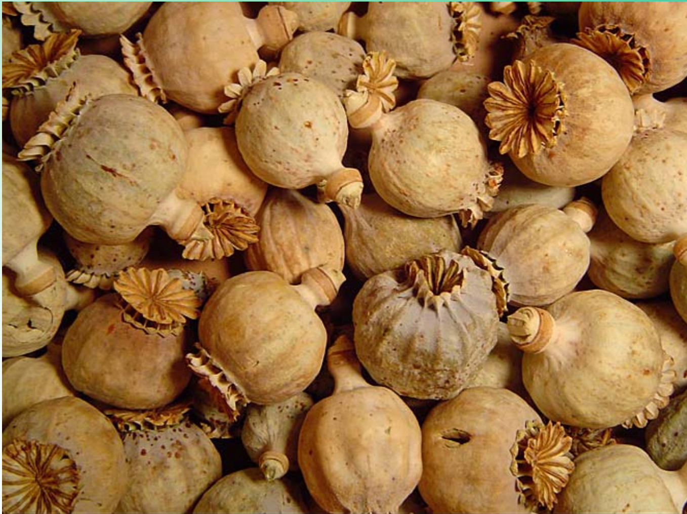
Dried Papaver somniferum Pods